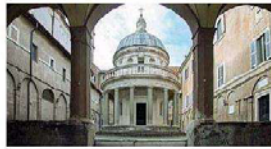
Cornice Il Tempio del Bramante a San Pietro in Montorio, Real Accademia di Spagna, uno dei luoghi coinvolti nel programma

Dal 26 ottobre visite, incontri, open studio