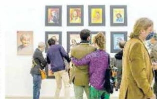
Una mostra alla Temple University nella passata edizione